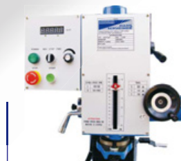
schwenkbarer Bohrkopf mit Digitalanzeige