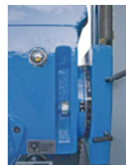
Anzeige der Bohrkopfeigung