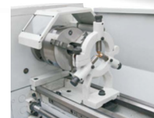
Lünette und Backenfutter