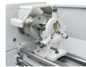
Lünette und Backenfutter