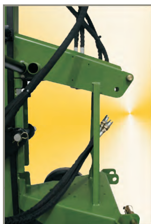
Ausstattung: Hydraulischer Anschluss an Zugmaschine