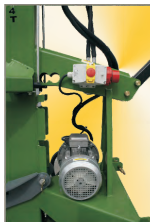
Ausstattung: Dreiphasen Elektromotor