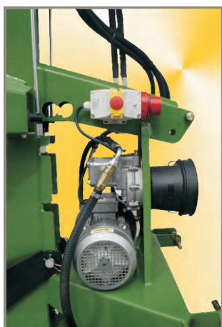
Ausstattung kombiniert: Zapfwellenantrieb Dreiphasen Elektromotor