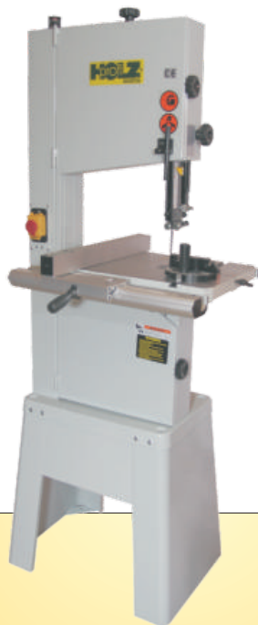
HBS SBW 3501