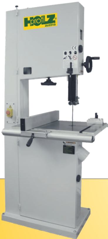
HBS SBW 4800 SBW 5300