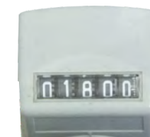
Mechanische Digitalanzeige (Option)